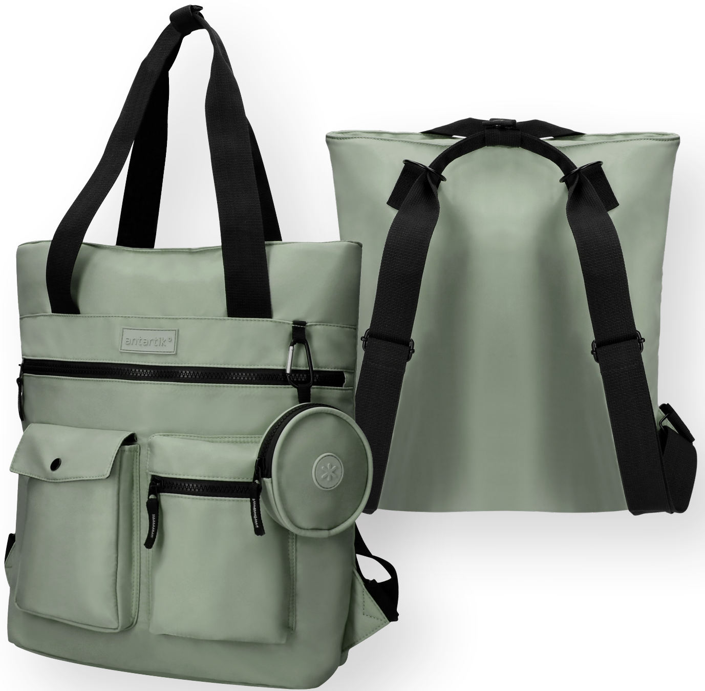
169449 VERT DE GRIS