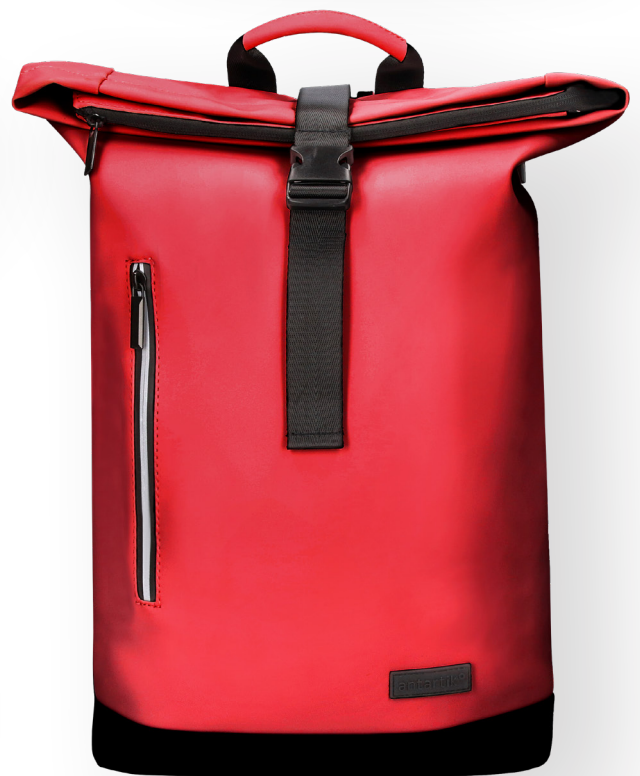
171947 ROUGE GRENAT