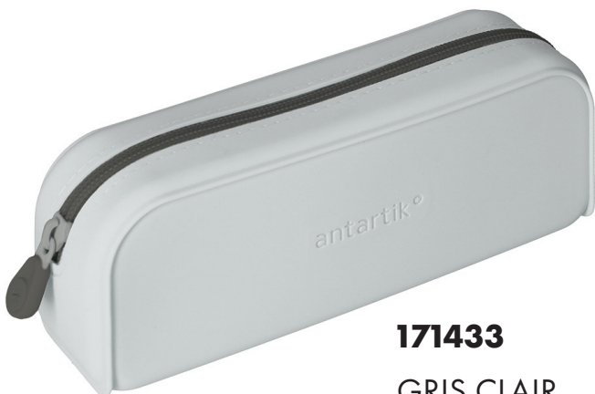
171433 GRIS CLAIR