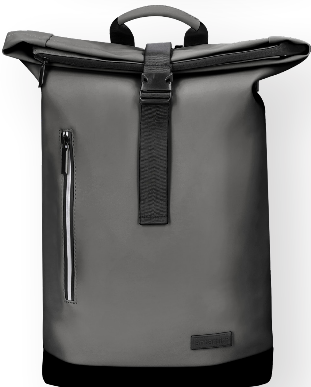
171945 GRIS FONCÉ