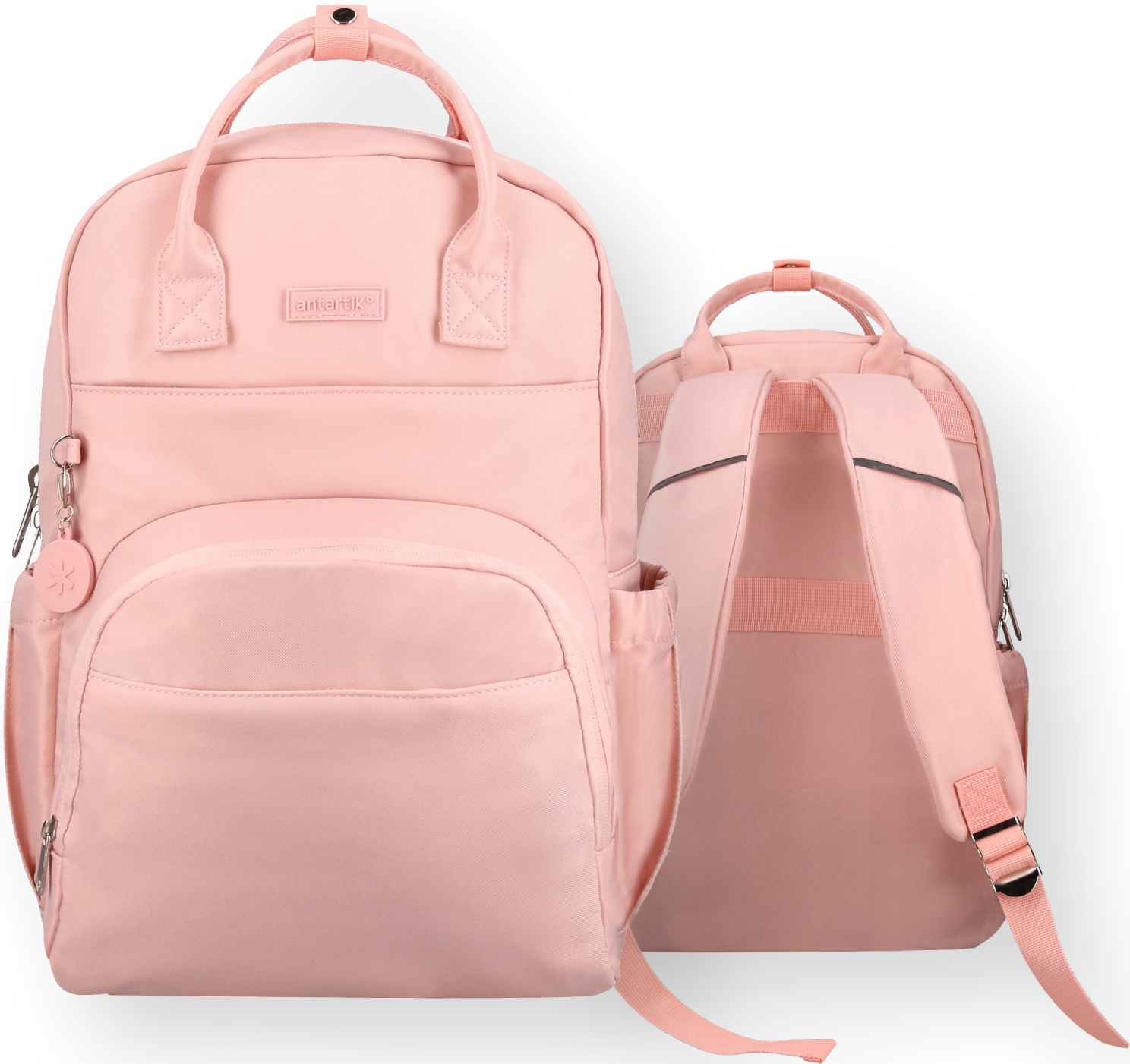
169256 ROSE IRISÉ