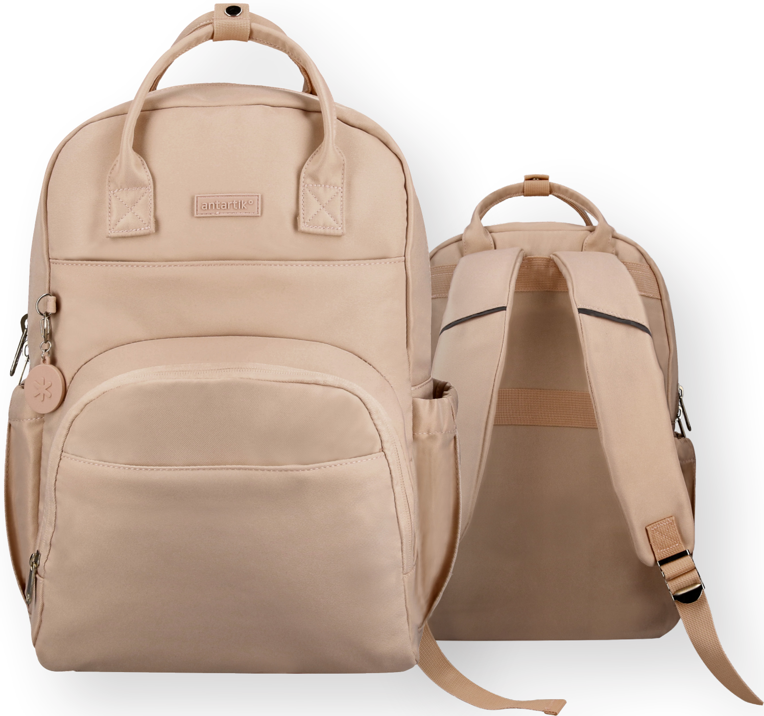
169258 BEIGE ROSÉ IRISÉ