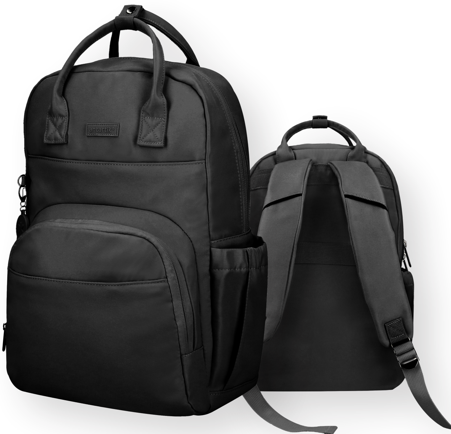
169259 NOIR IRISÉ