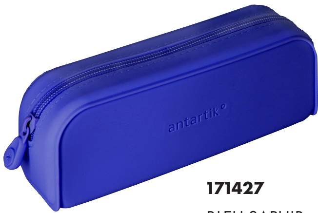
171427 BLEU SAPHIR