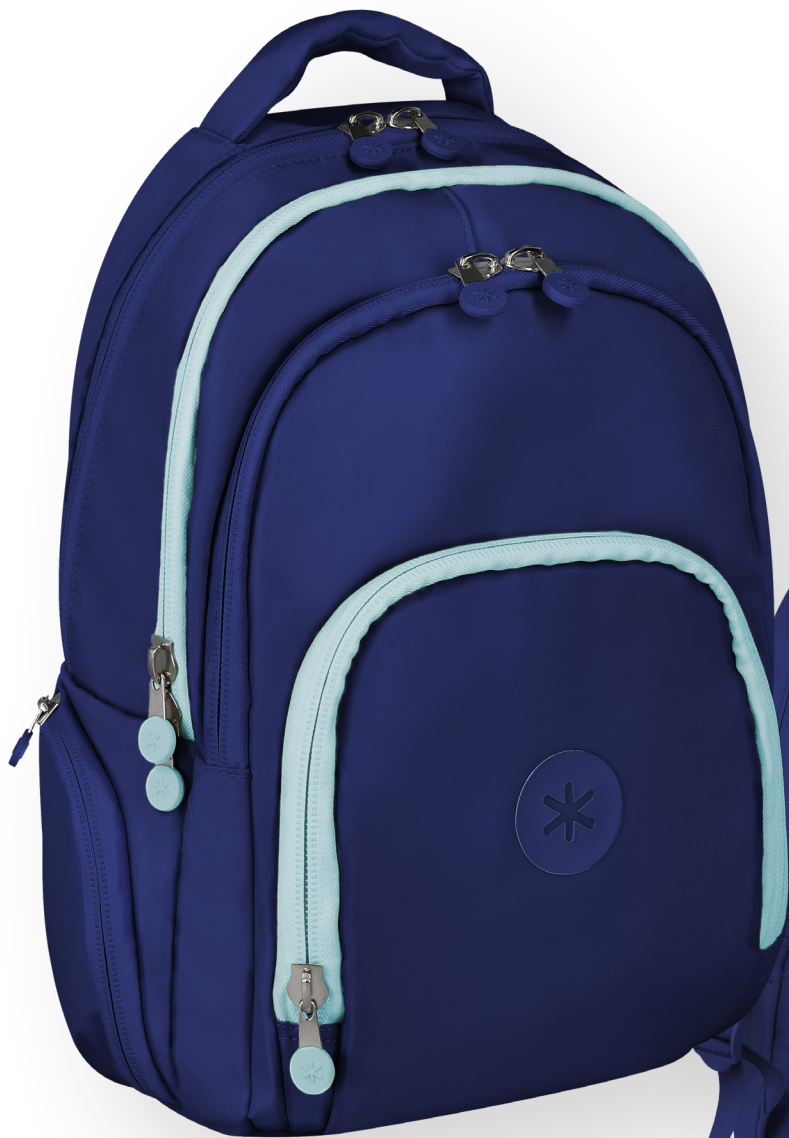
169418 BLEU MARINE