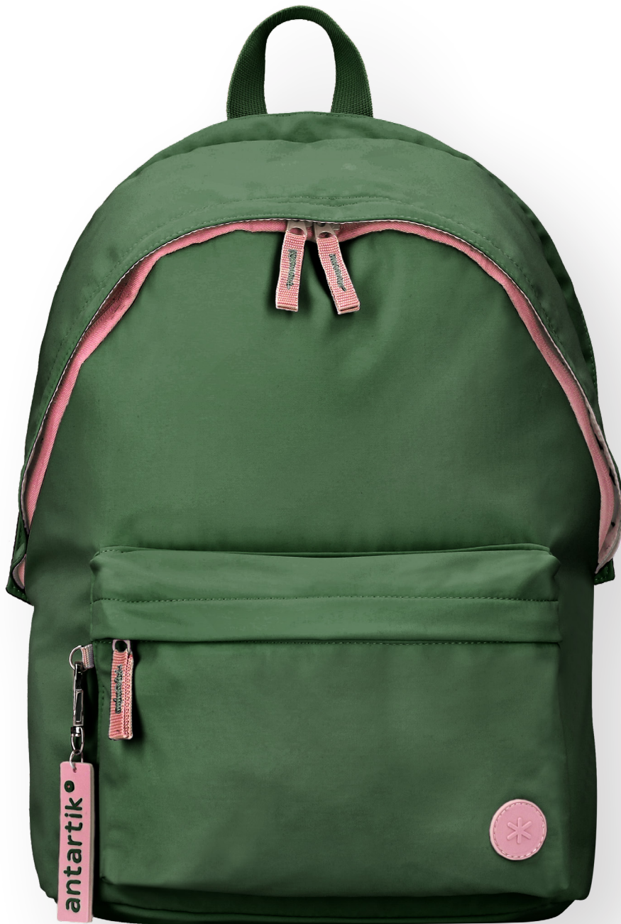
169432 VERT FORÊT