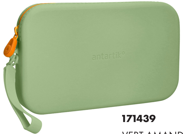
171439 VERT AMANDE