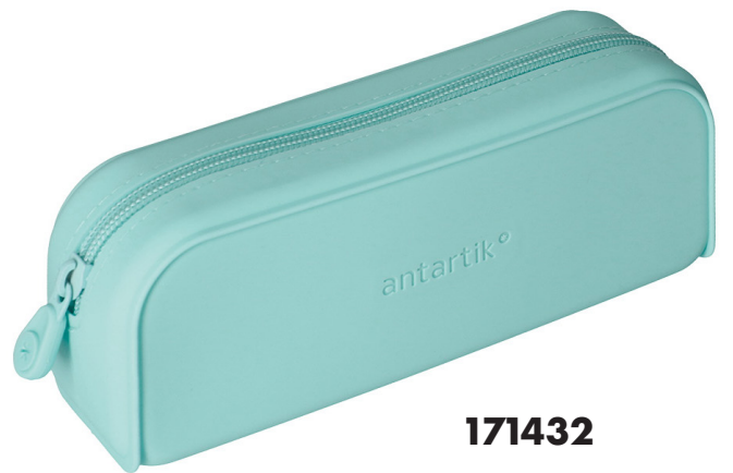
171432 VERT MENTHE