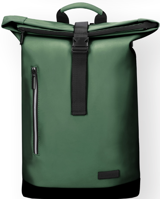
171948 VERT FORÊT