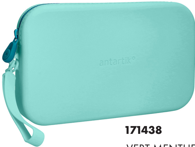
171438 VERT MENTHE